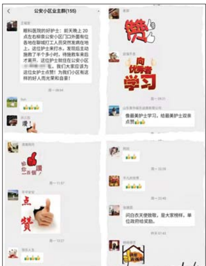
业主在微信群里寻找救人护士。