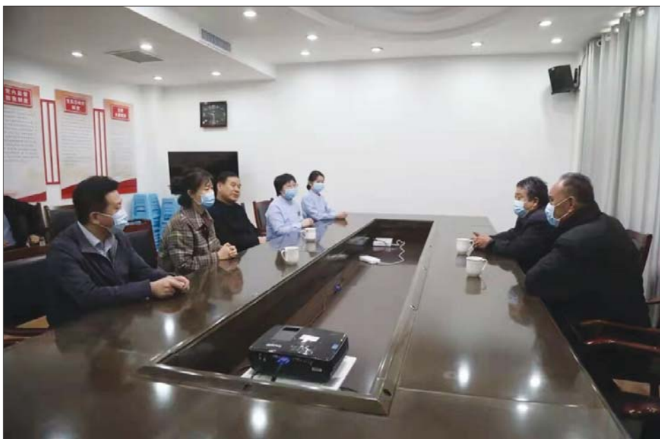
物业公司负责人到医院送锦旗。