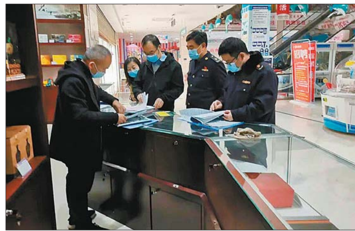
工作人员在大型商超、广场等地设置宣传点发放维权知识手册。

狠抓维权执法，让权益保护更加有力。积极开展市场监管检查专项行动，针对当前群众反映的消费热点、难点问题，围绕与民生、疫情相关的重点行业、领域，聚焦消费者投诉的重点场所、行业，切实加强市场监管执法力度。今年以来，共检查食品、药品经营等相关市场主体6800余户次，规范经营行为800余次，营造了安全、良好的消费环境。