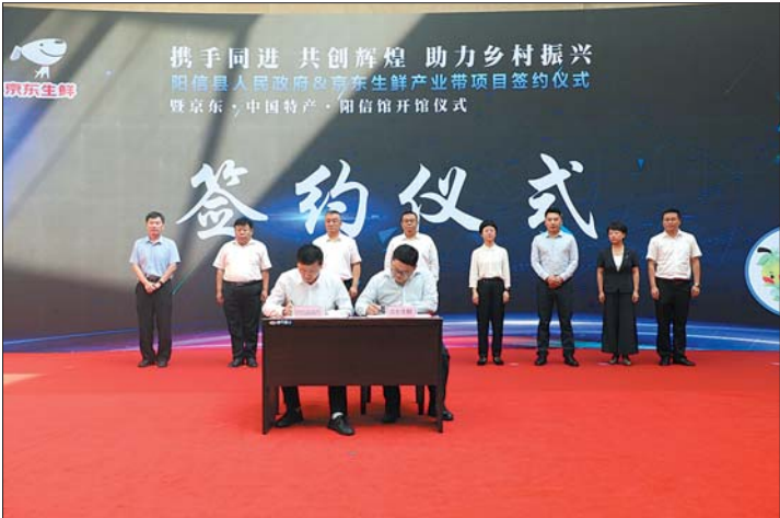
京东·中国特产·阳信馆开馆仪式

极培育赏花采摘、休闲度假、民俗文化等乡村旅游业态。创新发展智慧产业，注重数字技术应用，突出做好金阳媚梨示范园、商店润元农业产业园、水落坡收藏艺术小镇等项目。突出“一镇一业、一村一品”，围绕特色种养业、加工业和文旅业，争创农业产业强县，不断在打造乡村振兴齐鲁样板“阳信版本”上取得新进展。