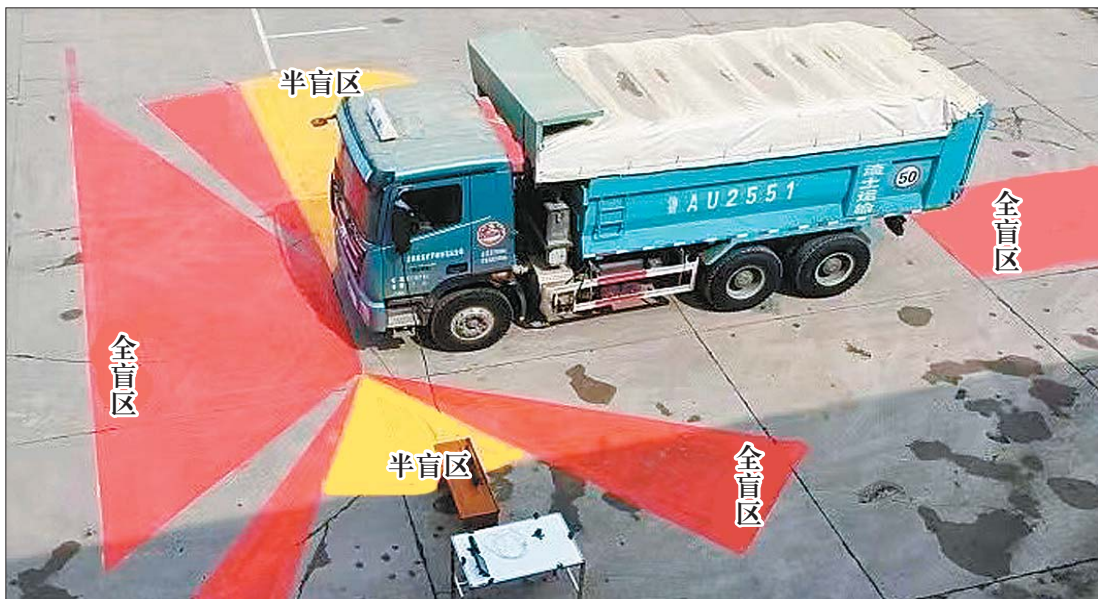
大货车右转区域分解图。

近期，针对防范大货车右转盲区的管理措施进一步升级，为最大限度预防和减少因视觉盲区