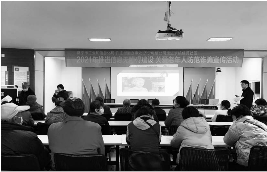
“推进信息无障碍建设,关爱老年人防范诈骗”的公益宣讲活动。

本报济宁12月2日讯(记者 刘凯平 通讯员 王萍) 11月30日上午,许庄街道京杭佳苑社区联合济宁市工业和信息化局、中国电信济宁分公司,为社区老年人带来了一场主题为“推进信息无障碍建设,关爱老年人防范诈骗”的公益宣讲活动。