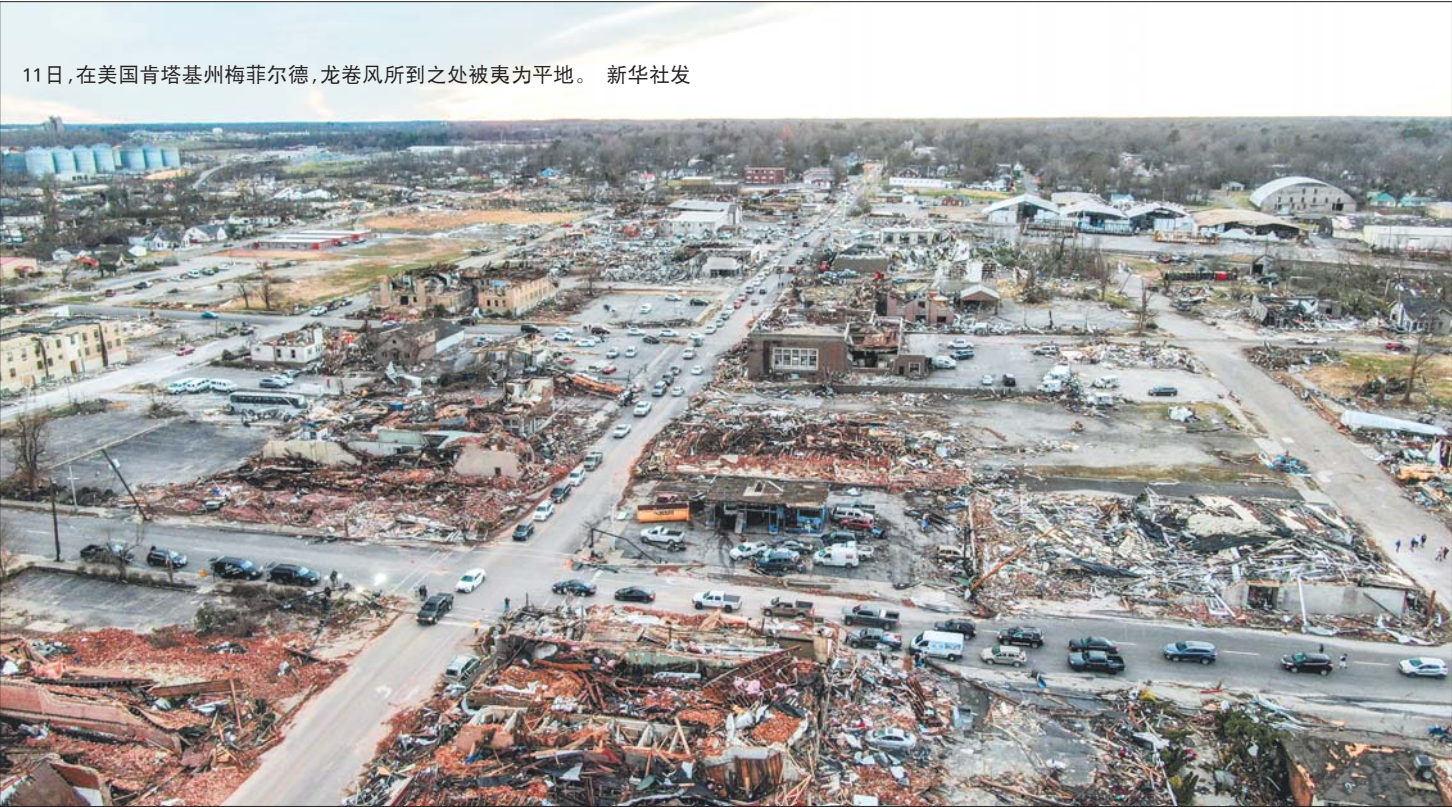
11日,在美国肯塔基州梅菲尔德,龙卷风所到之处被夷为平地。