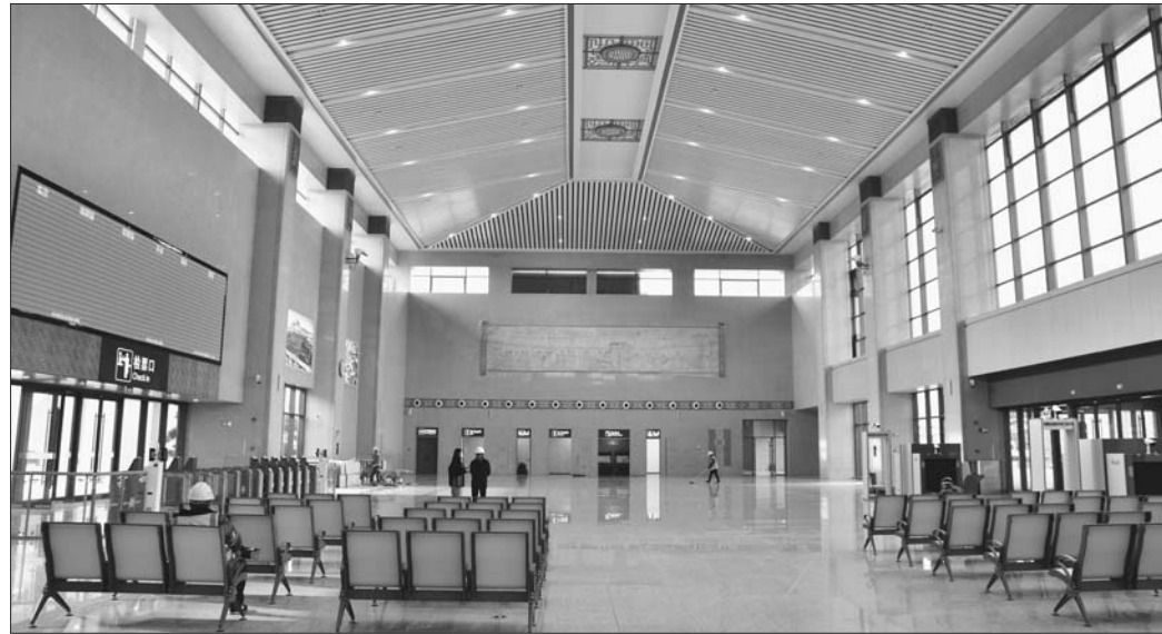
检票闸机已调试完毕。 (上接B01版)