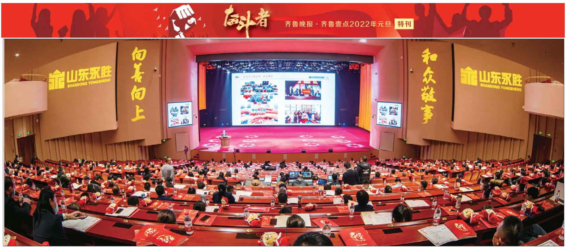
2021年度总结表彰大会。