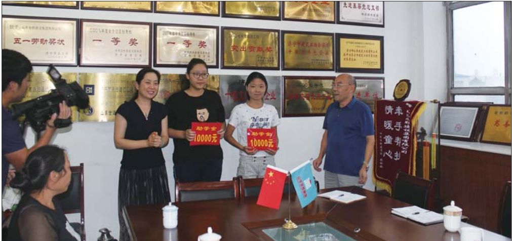
2016年6月永胜建设集团资助大学生。