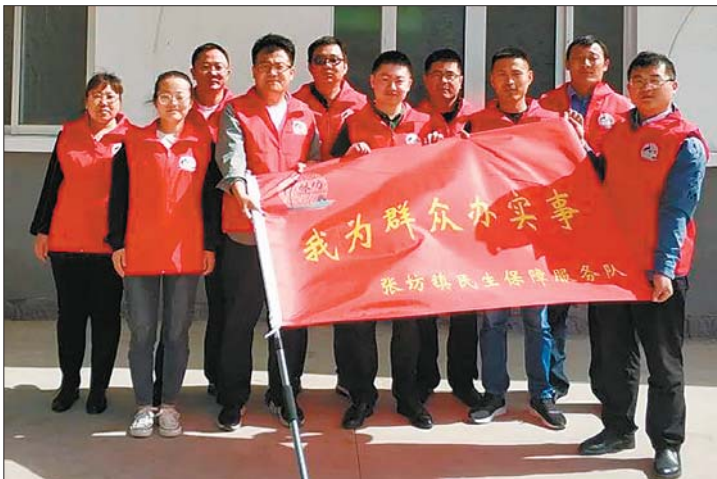
学党史办实事，张坊镇民生服务队。