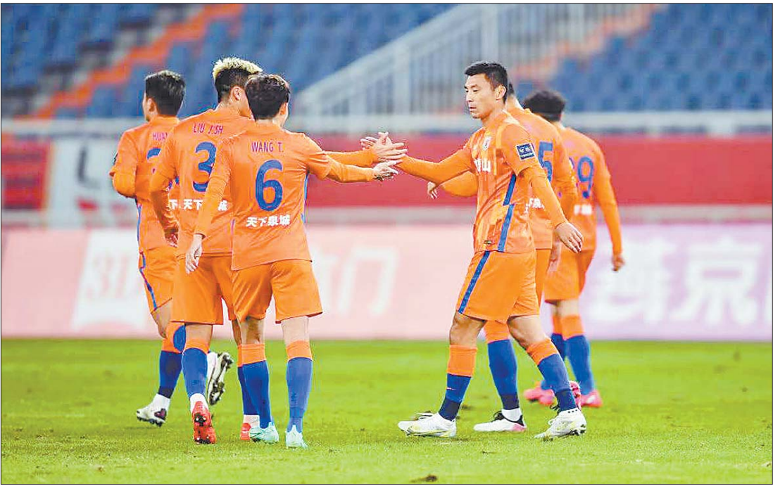
足足协杯决赛即将举行,泰山VS海港谁将载誉而归?(资料图)

凤凰山体育馆是第31届世界大学生夏季运动会核心场地,也是第18届亚洲杯足球赛主场馆之一。本场足协杯决赛,是对该场馆办赛能力的一次大考。1月7日下午,记者来到凤凰山体育馆得知,包括转播团队、安保人员、场地设施服务人员在内的工作人员,正在做最后的准备工作。 据了解,中国足协方面于4日左右开始接管该场馆。为保障场馆安全和防疫需要,规定除持相关证件与函的人员外,任何人不得出入场馆。此外,成都市足协也在此前宣布,鉴于目前严峻的疫情防控形势,决赛将空场进行。 为了尽可能营造气氛,官方在球场西侧看台布置了决赛的巨型Tifo,印有“申城正能量,未来大无穷”等标语。此外,记者了解到,除成都当地球迷将来到球场外围为泰山队加油外,也有部分山东球迷在明知比赛空场进行的情况下,来到成都为球队加油助威。 本赛季中超联赛,山东泰山积51分加冕冠军,上海海港积45分位居第二。联赛前两名在决赛