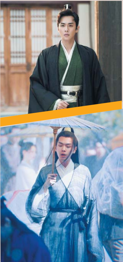
《庆余年》VS《雪中悍刀行》

所以，面对同是男频大IP改编剧的《雪中悍刀行》播出，很多观众提出疑问：为什么和《庆余年》那么像。两部剧都由男频大部头小说改编，都由王倦任编剧，主演都是张若昀，配角演员重合度很高。同样的男频爽文叙事套路，统一的编剧风格、相似的演员配置，让两部剧差不多成了双胞胎。