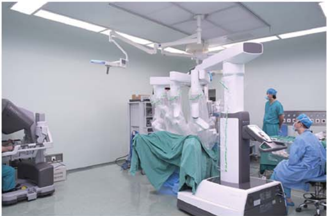
第四代达芬奇手术机器人——极大推动了济宁市第一人民医院外科手术进入“机器人辅助微创腹腔镜”时代,并在高难度外科微创手术领域实现重大突破,为提升医疗服务质量提供了强大的科技支撑,引领医院高质量发展,造福区域百姓。