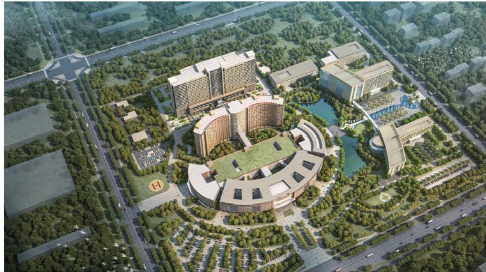
济宁市公共卫生重症医学中心暨市第一人民医院东院区二期工程。