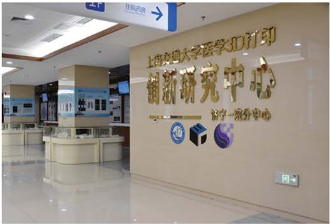
医学3D打印创新中心——为临床技术发展锦上添花,引领数字化医疗新趋势,该技术的广泛应用,使临床诊疗从经验医学走向数字化医学,对以往需要凭借丰富手术经验的复杂、高难度手术,借助三维重建、3D打印技术,将更多“不可能”的手术成为“可能”。