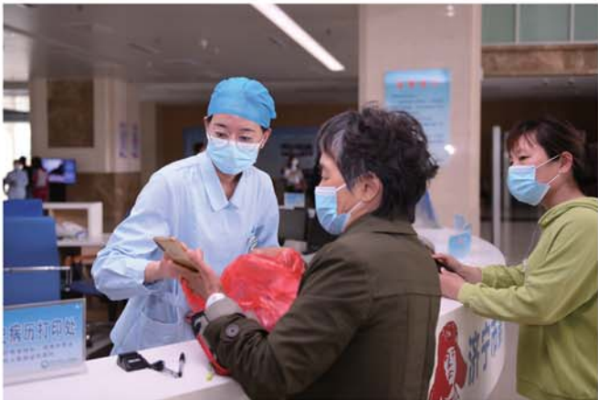
全国首创推出门诊“一次性”全程诊疗服务获点赞。

近日,济宁市第一人民医院发布“2021年度公益报告”,让我们一起感受这家百年优质人文医院的暖心善行。