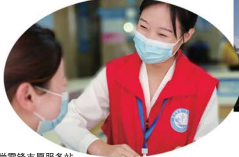
学雷锋志愿服务站。

在智慧医院建设方面,率先实现了“一站式”后勤服务模式的运用,建立综合能源管理平台 and 能源消耗指标体系,实现能源利用最大化。同时,挥动绩效考核指挥棒,利用RBRVS和DRGs,成本监测系统等信息化管理手段,进行精细化管理,实现费用可控、员工积极性提高,老百姓得实惠的目的。医院先进做法引发国内135家医院同行参观交流;医院连续四年,在中国医院院长大会、年会上作典型发言。