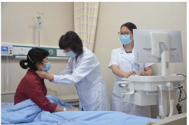
“以患者为中心”,为百姓提供温暖、高质量的医疗服务。