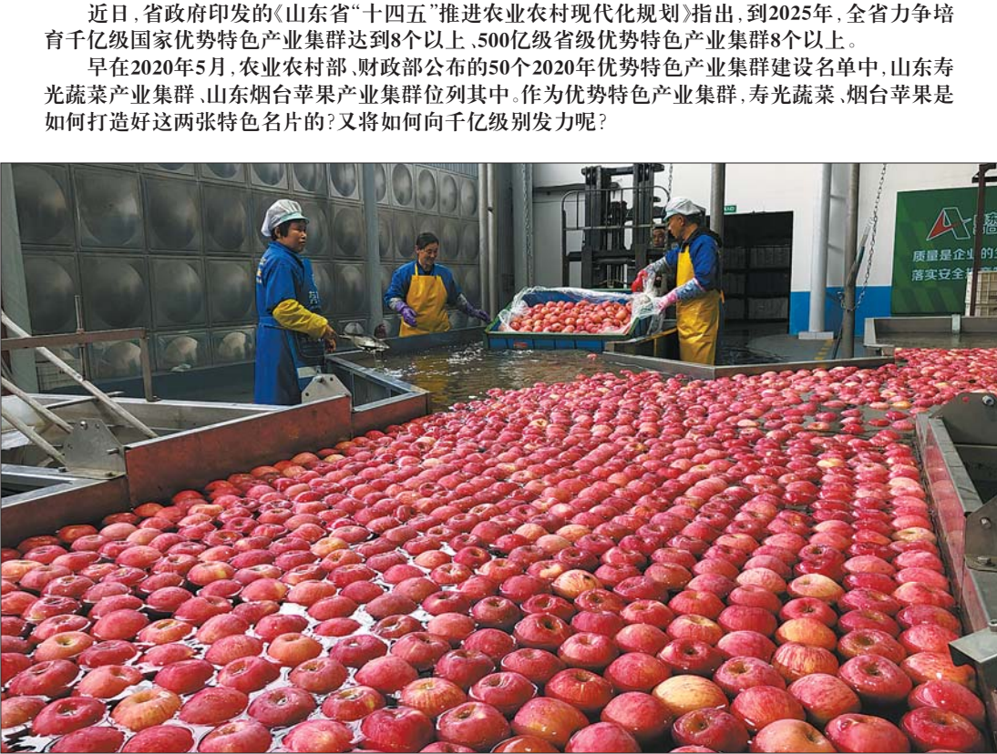
烟台苹果已经走上高质量发展的转型之路，这是苹果在全自动分选设备上进行清洗、分级。 本报资料片

继登上北京奥运会、上海世博会、G20峰会、青岛上合峰会等重大活动的舞台后，烟台苹果飞上太空，烟台籍航天员王亚平在太空吃到烟台苹果。坐拥145亿元品牌价值的烟台苹果，也因此再次有了一个新的身份——“太空苹果”。 烟台是中国苹果栽培最早的地方，美国传教士倪维新在1871年将西洋苹果引进烟台，在烟台毓璜顶建起了“广兴果园”。50余年的现代苹果栽培史，造就了“烟台苹果”这个响当当的龙头品牌。截至2020年，烟台苹果品牌价值已超145亿元，连续12年蝉联中国果业第一品牌。 放眼国内苹果市场，新疆阿克苏、甘肃天水、陕西洛川等知名品牌百花争艳，“太空苹果”烟台苹果是如何保持住优势，坐稳苹果业“头把交椅”的？ “烟台苹果有着得天独厚的气候、地理优势。位置上，烟台处于北纬三十七度的黄金带，非常适宜苹果生长。第二，烟台地域多丘陵、山地，且海拔不是太高，降水适中、光照又充足，种粮产量、效益并不是很高。但是光照很充足，雨量比较大，有助于烟台形成优势产区。”山东苹果·果业产业技术研究院副院长姜中武表示。 维持住既有优势的同时，烟台苹果在科研上不断投入和产出。烟台市农业农村局数据显示，烟台先后承建苹果领域国家级工程技术中心（实验室）4个、水果良种苗木繁育重大项目十余项。目前，全市现有苹果苗木基地5000亩、年产苗木3000万株，其中2000万株销往全国各地，销量约占全国的40%。其中，烟台苹果科技创新中心是全国首家苹果类专业新型研发机构、全省唯一的果业类创新创业共同体。 烟台苹果产业集群快速发展的背后还有烟台市政府的持续支持。为推动苹果产业高质量发展，截至目前，烟台市财政专项支持资金累计达到3.15亿元，全市更