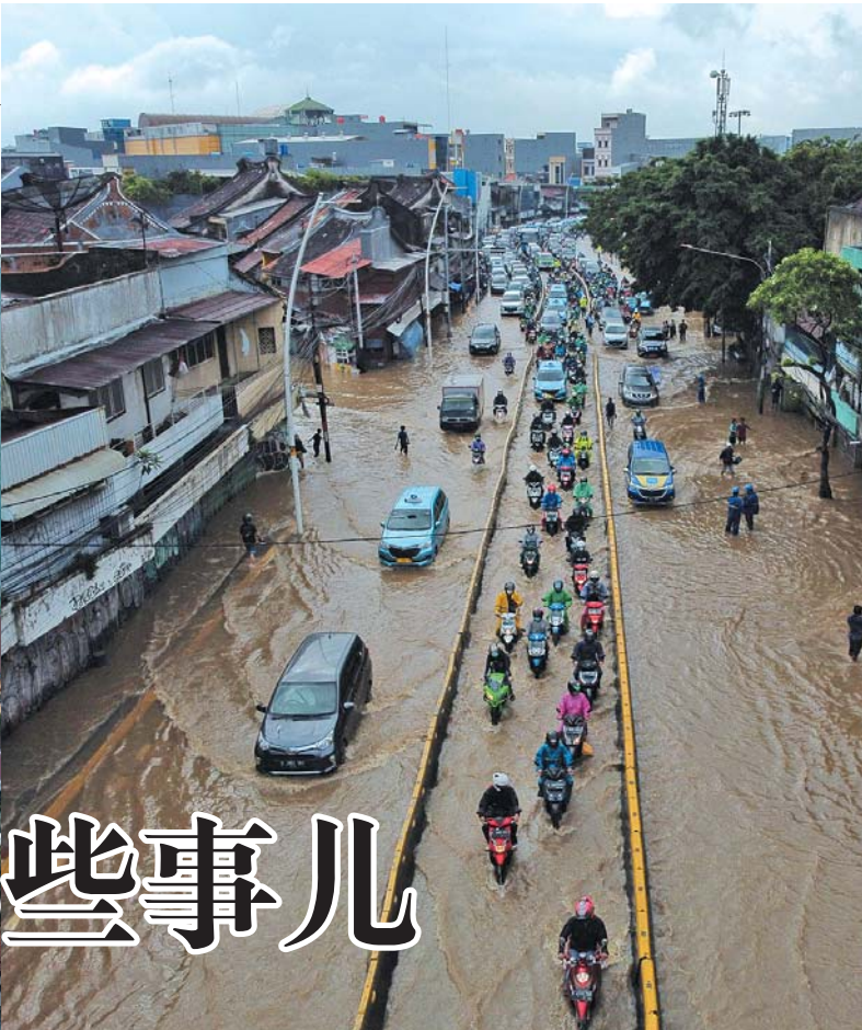
车辆在印尼首都雅加达被洪水淹没的街道上行驶。