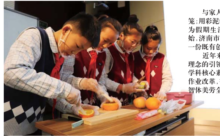
学生制作水果拼盘。