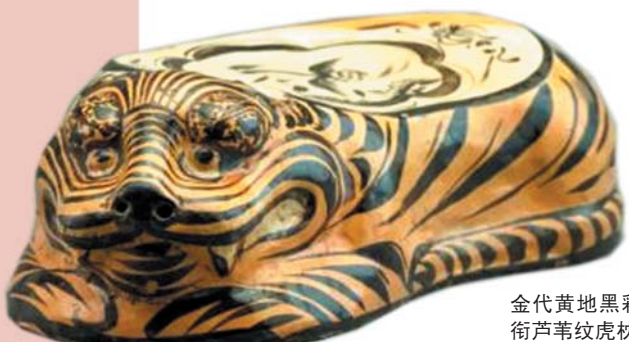
金代黄地黑彩雁衔芦苇纹虎枕

中国的青铜,兴于王政,盛于三代;被视为王者之器,表现着庙堂、王权、秩序的神秘、庄严和威仪。本次展览展出的280件(套)青铜器珍品,既有中国国家博物馆众多宝藏,也有湖南省博物馆、四川广汉三星堆博物馆等典藏青铜瑰宝,它们是古代物质文化和精神文化的载体;从中我们可以窥见商周青铜器的庄重典雅,以及汉至明清青铜器的传承和变化。灼灼铜华,代代相传;青铜不朽,王者归来。在时光长河中,青铜器由厚重而轻巧,从庙堂走入民间,唤醒华夏儿女骨子里的礼乐文化记忆。