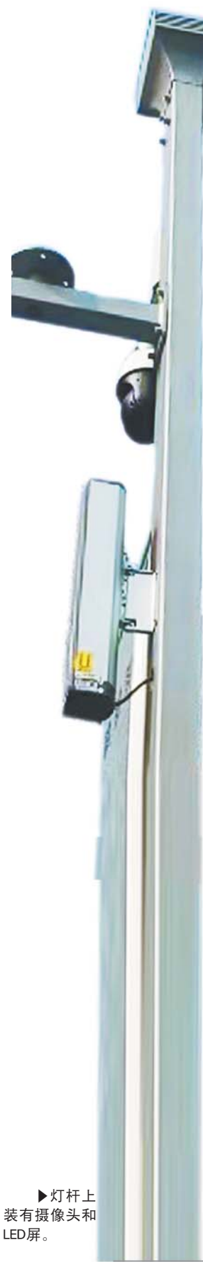
灯杆上装有摄像头和LED屏。