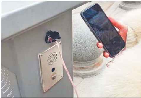
智能灯杆可连接USB口进行充电。

2月15日上午,记者来到天桥区工人新村北村,在社区北街、中街、二街附近看到许多智能路灯,该智能路灯外观上呈灰色,路灯顶部还装有摄像头和LED屏幕,中部有个一米多高的基座,基座上有一个无线充电小平台,仅需放置手机就可充电,底部位置还有连接USB数据线的插口。 据附近居民介绍,大部分灯杆是去年12月份左右安装的,目前还未见正式投入使用。“路灯安装以后,只见到过一次试亮,之后就再没亮过了。”一商店老板表示。 记者在现场发现,多处路灯表面已经积灰,尝试用无线充电台、USB数据线给手机充