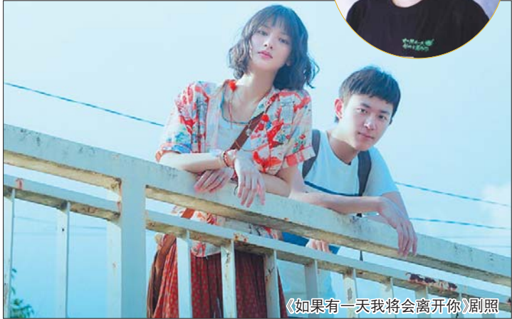
《如果有一天我将会离开你》剧照

“艺二代”与他们的父辈刚踏入影视圈时，处于截然不同的时代背景中，在成长经历、时代环境、艺术潮流等都发生变化的情况下，他们不可能延续父辈的艺术风格，或者模仿他们走过的路。年轻一代更多的是在顺应时代，顺应自我的艺术追求。现在不少“演员二代”甚至在名气、成绩上都超越了父母辈，得到观众认可。“导演二代”同样在艺术氛围中长大，有超越普通孩子的艺术熏陶乃至资源优势，接过父辈的接力棒，也可能走出自己更好的路。