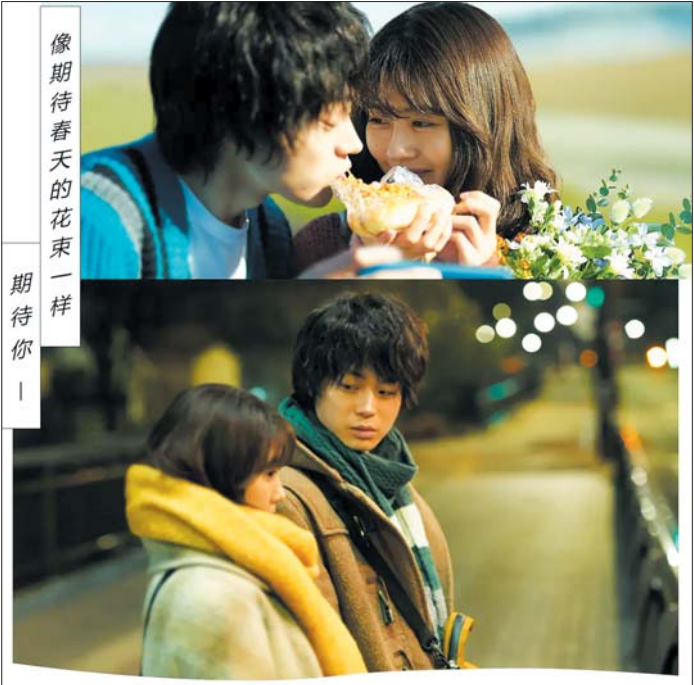
高分爱情片《花束般的恋爱》剧照

上映首日揽下1.43亿元票房，中国影史情人节档新片单日票房冠军……一长串的闪亮数字，也挡不住情人节档新片《十年一品温如言》全线崩塌的口碑，另外两部爱情电影《好想去你的世界爱你》《不要忘记我爱你》则扑得悄无声息。情人节档过后，爱情题材电影依然火热，哪一部可以绝处逢生？