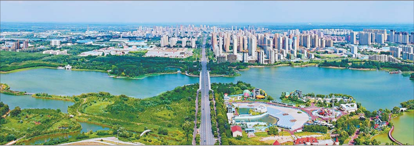
优化城市发展空间,推动城市功能品质不断提升。

2月24日,济南市济阳区第十九届人民代表大会第一次会议开幕。会上,济阳区委副书记、区长黄晓广向大会作政府工作报告。报告字字铿锵,句句振奋。 今后五年,济阳力争综合实力迈上新台阶、创新发展实现新突破、改革开放跃上新高度、生态环境得到新改善、共同富裕取得新进展。2022年主要预期目标是:生产总值增长8%以上;固定资产投资增长13%;一般公共预算收入增长8.5%;规模以上工业增加值增长9%;社会消费品零售总额增长9%以上;实际使用外资增长15%以上;城乡居民人均可支配收入增长8%左右;城镇登记失业率控制在3.5%以内。 发展蓝图已清晰展现,济阳将抢抓战略机遇,深入对接融合,全面建设高质量北部中心城区。