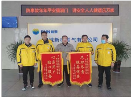
为用户排忧解难的贴心服务受到高度赞扬。