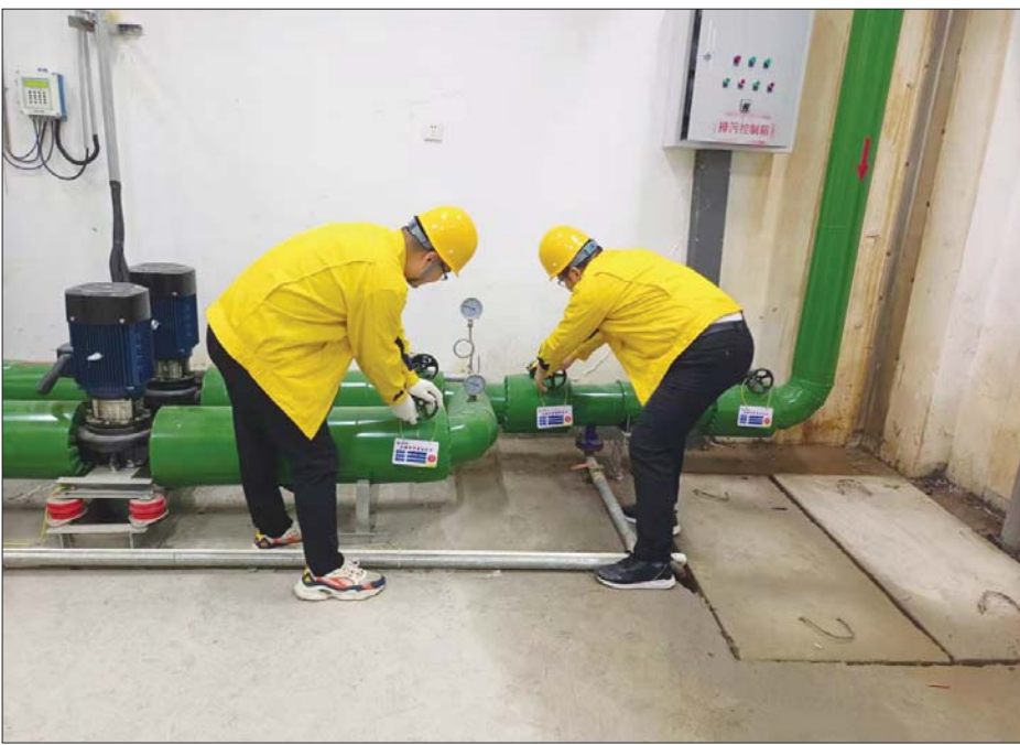
聊城新奥工作人员检查安全隐患。

凭借清洁能源所带来的环保效益,多年来,聊城新奥累计供应天然气超过35亿方,相当于减少标准煤424万吨,减排二氧化碳1043万吨、二氧化硫31.8万吨、氮氧化物15.9万吨,有效助力聊城实现碧水蓝天,未来,聊城新奥将一如既往为全市天然气产业的安全、可持续、健康发展贡献力量,助推聊城市新旧动能转换,为全市经济的跨越式发展做出新的贡献。