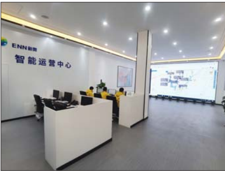
聊城新奥智能运营中心全方位保障燃气安全。