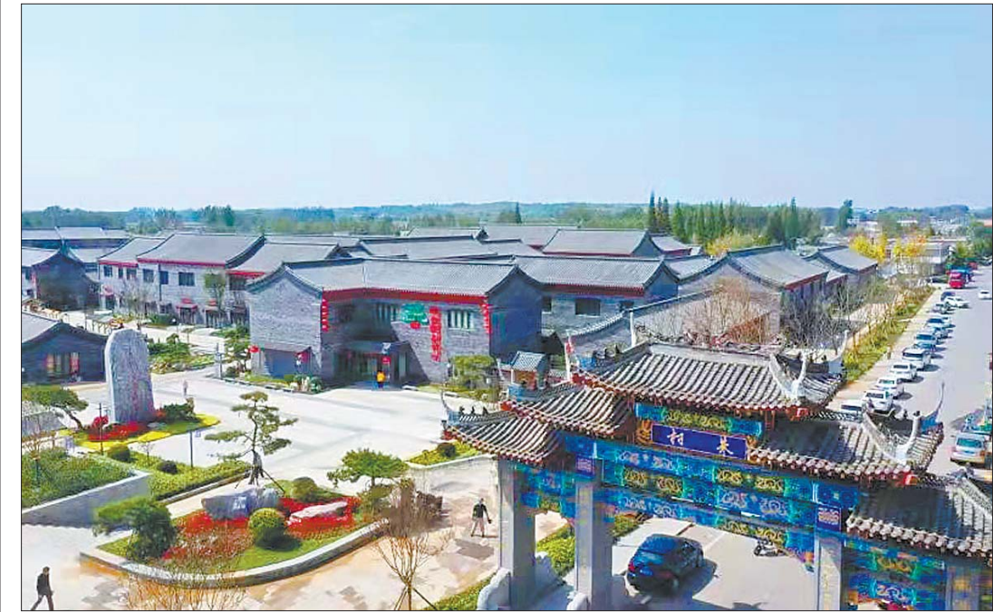
朱村红色旅游区每天吸引千人来打卡。

2013年11月25日,习近平总书记来到临沭县曹庄镇朱村,观看这个抗战初期就建立党组织的支前模范村村史展,了解革命老区群众生产生活。 9年过去了,近日记者探访看到,在村东,朱村党支部领办的珍珠苑种植专业合作社里,数百亩葡萄正在为新一季丰收积蓄养分。这个合作社规划总占地1500亩,除了葡萄还有有机蔬菜、晚秋黄梨等种植园。可提供500多个就业岗位,年产值2400万元,为村集体增收30万元。