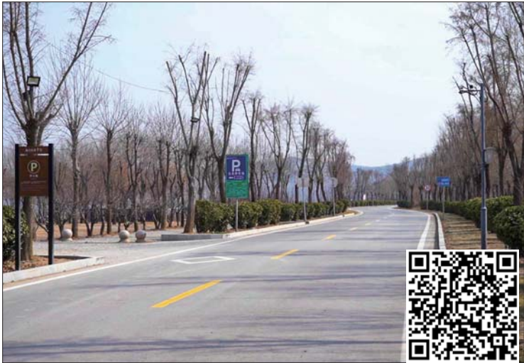
金屯镇谢城村平整的马路。

济宁市2018年启动“四好农村路”建设三年集中攻坚专项行动，实施路网提档升级、自然村庄通达、路面状况改善、运输服务提升“四大工程”。如今，一条条“四好农村路”如毛细血管一样，连接城乡，构筑起四通八达的交通路网，成为群众的产业路、致富路、幸福路。