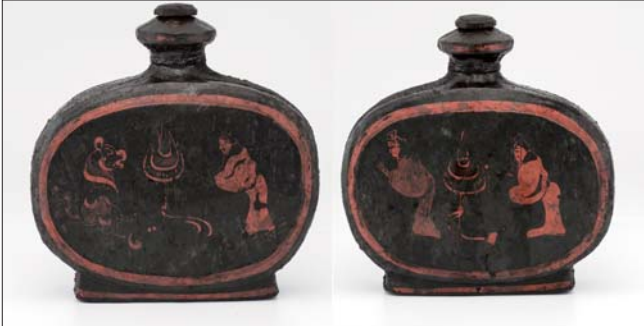
湖北云梦县郑家湖战国秦汉墓地出土的扁壶。 新华社发