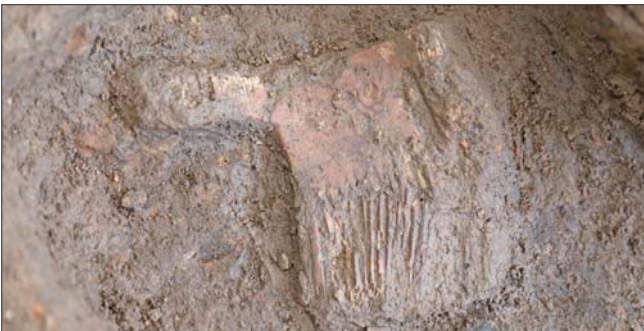
河南南阳市黄山新石器时代遗址出土的屈家岭文化骨梳。 新华社发