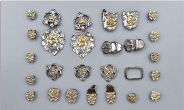
甘肃武威市唐代吐谷浑王族墓葬群慕容智墓出土的鎏金银饰件。

明宪宗与年长他17岁的宠妃万贞儿的爱情故事，相信大家已是耳熟能详。殊不知，朱见深不但专情、痴情，还具有极高的绘画天赋。在他所有的绘画作品中，现为故宫馆藏瑰宝的《一团和气图》，是其治国理念，也是其性格特点最好的体现。