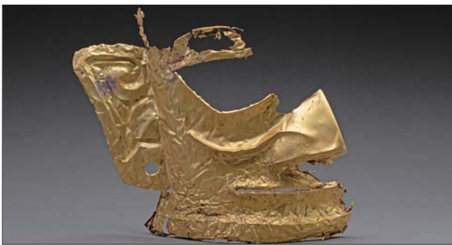
四川广汉市三星堆商代遗址五号坑出土的金面具。