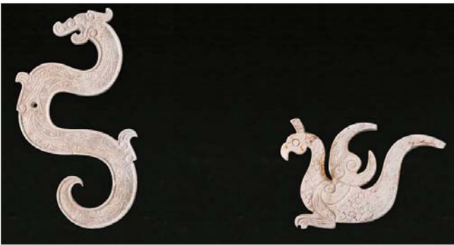
江西樟树市国字山战国墓葬出土的玉龙、玉凤。