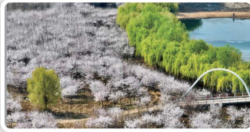
一朵朵、一簇簇，盛开的樱花用独特的姿态装点新区。