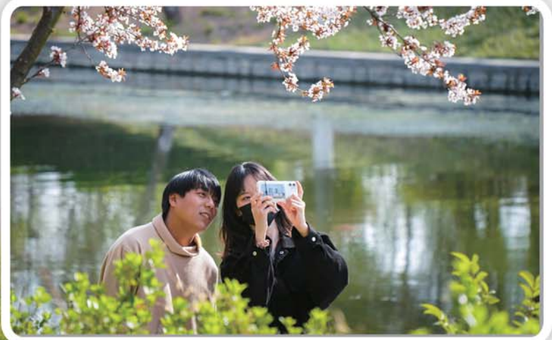
随春风飘舞的花朵，吸引路人驻足观赏、拍照。