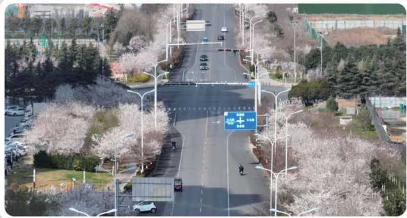
“樱花大道”蜿蜒在楼群之间，风景如画。

太白湖新区自2018年以来开始逐步实施“花满新城”和“立体绿化三年行动计划”，高标准制定了城市景观风貌规划，坚持“一路一景、一道一花”的原则，倾心打造“花满街”“花满园”“花满地”“花满架”“花满墙”“花满塘”等花园城市景观。“一路一景”“一道一色”，新区建成了京杭路红叶大道、渔皇路樱花大道、河都路紫荆大道、奥体路海棠大道、运河路月季、玉兰大道、谭岗路流苏大道、济安桥路梅花大道等特色景观道路。城在花中、花城相依、人在花下、乐在芳草间的浪漫花都意境初见成效。