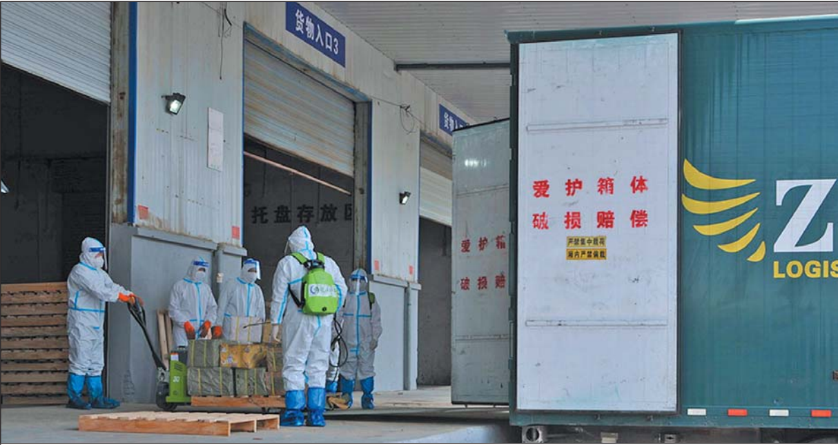
对进仓货物进行消毒。

3月17日开始,济南市公安局交警部门在环济主要公路出入口设置24小时检查点77处,其中:高速公路收费站52处、国道15处、省道10处,覆盖了所有与周边城市相连的主要通道,截至4月6日,全市累计出动交警9583人次、警车4098辆次,检查车辆92.8万辆次,劝返重点地区来济车辆1.52万辆次。 目前,济南着力抓好济南火车站、济南西站、济南东站、大明湖站和境外入济航班的重点地区及其他中高风险地区旅客转运工作。对于所有出站体温检测异常的旅客,一律通过120救护车送往指定医院进行医学观察。本轮疫情以来,累计查验铁路旅客约18.9万人,转运506人。 对于目前济南“菜篮子”保障情况,济南市农业农村局党组成员、副局长王奉光介绍,济南市常年蔬菜种植面积148万亩、年产量达670万吨,平均日产量为1.8万吨,“在这个总量的保障下,不管疫情形势怎么变化,我们有能力保证近1000万市民每天有菜吃,而且吃得越来越好。”