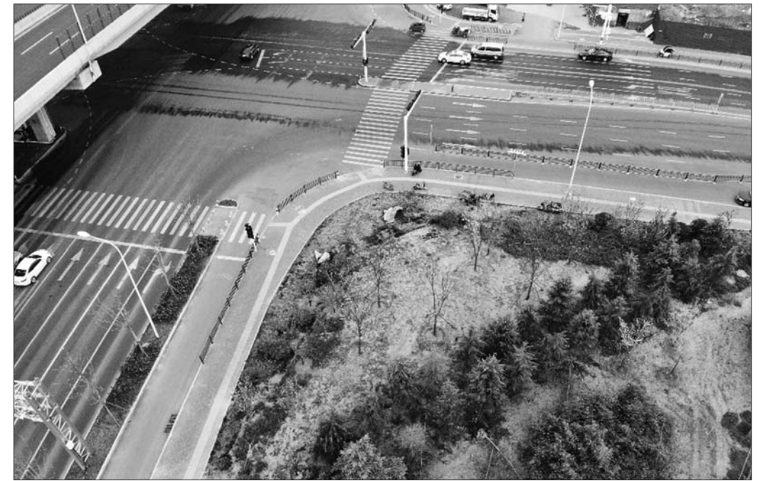
正在建设中的口袋公园。

3月下旬起,济宁中心城区口袋公园建设相继展开,一处处市民“家门口的花园”见缝插绿、播绿点翠,将不断增强市民群众的获得感、幸福感。截至目前,今年济宁中心城区已新开工口袋公园32处,预计6月底完成60%以上,10月底全部完成。