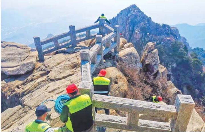
4月6日,泰山岱顶环卫工清理垃圾,为景区复工做准备。 齐鲁晚报记者 薛瑞 通讯员 刘佐仓 摄影报道

省交通运输厅副厅长司家军在回答记者提问时介绍,山东交通运输系统从严从紧从实抓好疫情防控,全力做好重点物资运输保障工作。全省各市《重点物资运输车辆通行证》已累计办理44万余张,其中电子通行证16.6万余张,目前单日网上办理已超过2.35万张,占办理总量的80%以上。建立重点物资应急运输联系协调机制,全力保障各领域重点物资应急运输。