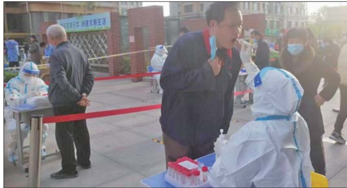
人社局工作人员到社区助力防疫。

本报4月14日讯(通讯员 李世忠) 4月13日,济阳区人社局60余名工作人员下沉闻韶佳苑社区,助力开展核酸检测。