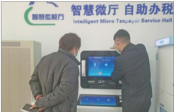
银行客服人员帮助客户办理业务。

支行积极向前来营业厅办理税务的客户进行引导宣传,将农商银行“智慧厅堂”与税务局“智慧税务”有机结合,通过线上平台群发短信和线下宣传等方式把优惠的金融服务和最新的税收政策“送上门”。截至3月末,已办理代开税