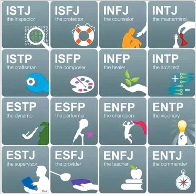
MBTI测试结果16种类型示意图