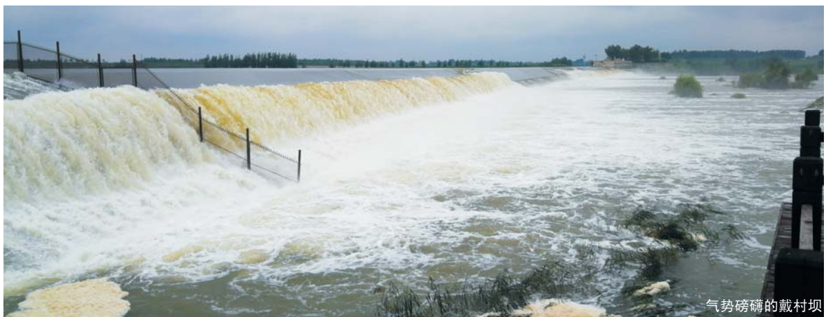
气势磅礴的戴村坝

位于会通河临清段西岸的运河钞关，是大运河沿线也是中国现存唯一的钞关旧址，属明清时期运河八大钞关之首。临清运河钞关，是15-19世纪(明清时期)在大运河航线上设立的一个专门针对运河上来往的商用载货船只征收船税的机构。作为运河文