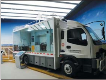
考古文物整体搬迁与保护展示

家考古类奖项的重点项目。其中,展厅内展示了石峁遗址的外城东门址遗址模型,可以看到目前所知最早的城墙上的防御性构筑——马面。展厅还模拟了一段石峁的墙体,可以看到有石雕和石墙中的“红木”,红木的作用相当于现在混凝土中的钢筋。过去建筑学认为“红木”的运用最早始于汉代,石峁红木的发现将此技术提前了一千多年。在城门基址上还分布了一些