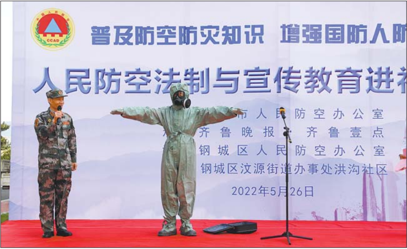
人防工作人员为钢城市民演示防化服的防护功能和使用方法。

上台体验。“防化服在平时是难得一见的,这次试了试之后,感觉很有安全感!” 此外,人防办工作人员还为大家演示了手摇防空警报器的使用。“预先警报信号为鸣36秒、停24秒,反复3遍为一个周期;空袭警报信号为鸣6秒、停6秒,反复15遍为一个周期;解除警报信号为连续鸣3分钟。”第一次见到手摇防空警报器,市民积极上台体验。体验结束后,大家都领到了一份人防战备应急包。据了解,人防战备应急包是人防部门针对防空袭和防灾减灾需要而配备的物资便