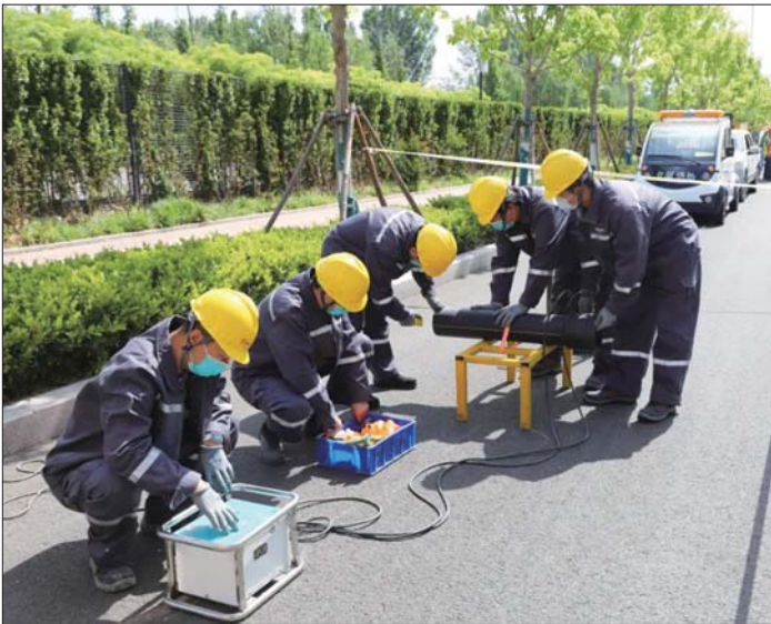
城市防汛应急综合演练现场。

本报济宁5月30日讯(记者 刘凯平 见习记者 丁安顺) 5月26日,太白湖新区城市防汛抗旱指挥部组织开展