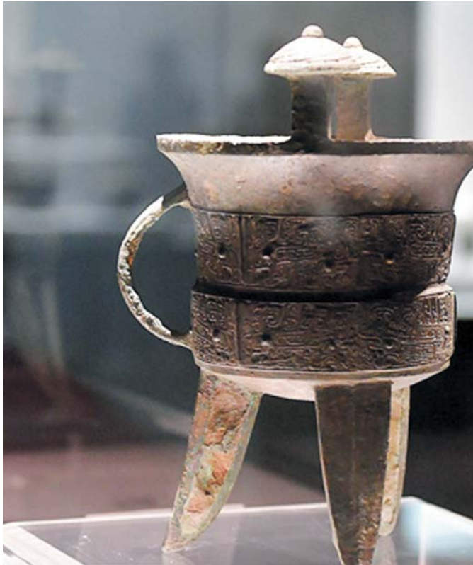
游客在洛阳博物馆“河洛文明”展厅参观