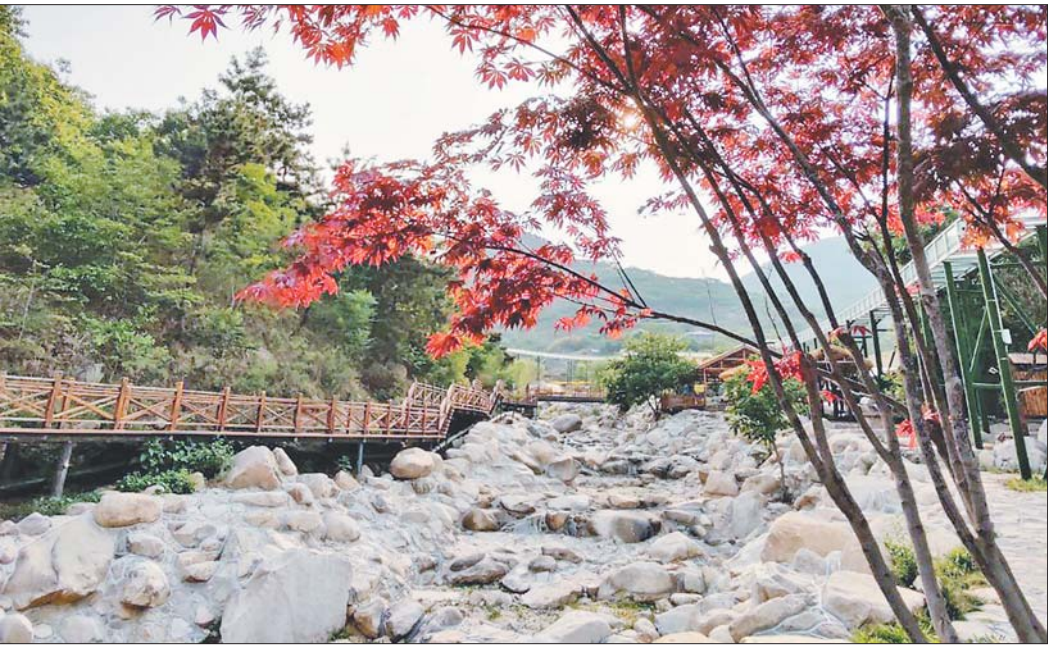
按照4A级景区标准，蒙阴县对椿树沟进行了旅游基础设施提升。

沂蒙山区七十二崮，三十六崮在蒙阴；卫星地图上蒙阴全境绿意浓烈、水波荡漾。蒙阴富集旅游资源，可是旅游开发是个投资大、见效慢的艰难事。GDP、财政收入常年在临沂全市靠后的蒙阴县，在发展旅游特别是乡村旅游上却毫不吝啬。比如仅在椿树沟一地，当地就投入9000多万元按照4A级标准提升基础设施建设。2022年端午节来临之际，蒙阴景区频频成为旅游目的地搜索热词。