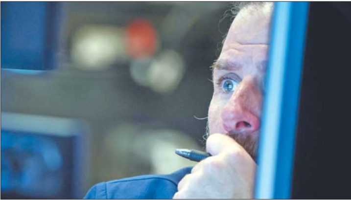
6月14日,交易员在美国纽约证券交易所工作。

本报讯 自美国总统拜登去年1月就任以来,标准普尔500种股票指数先涨后跌,眼下已回吐全部涨幅。这一蓝筹股指数纳入苹果、微软、亚马逊、特斯拉和伯克希尔-哈撒韦公司等知名企业股票,被视作最能代表美国股市和经济的股指之一。