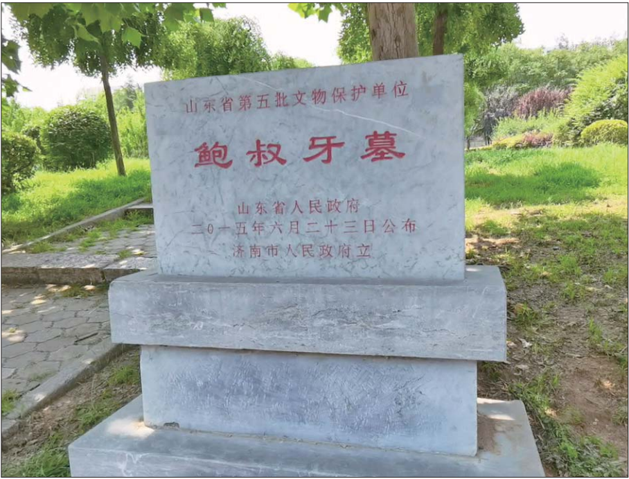
鲍叔牙墓文物保护碑。

6月13、14日和16、17日济南两轮核酸贴纸上的人物是鲍叔牙。提起这位春秋时期的齐国大夫，很多人都会想到“管鲍之交”“勿忘在莒”。而你可能不知道的是，济南曾经有三鲍，“鲍城、鲍山和鲍墓”，而今鲍城早已消失在历史风雨中，但鲍山和鲍墓依然矗立在济南鲍山街道的沃土上。