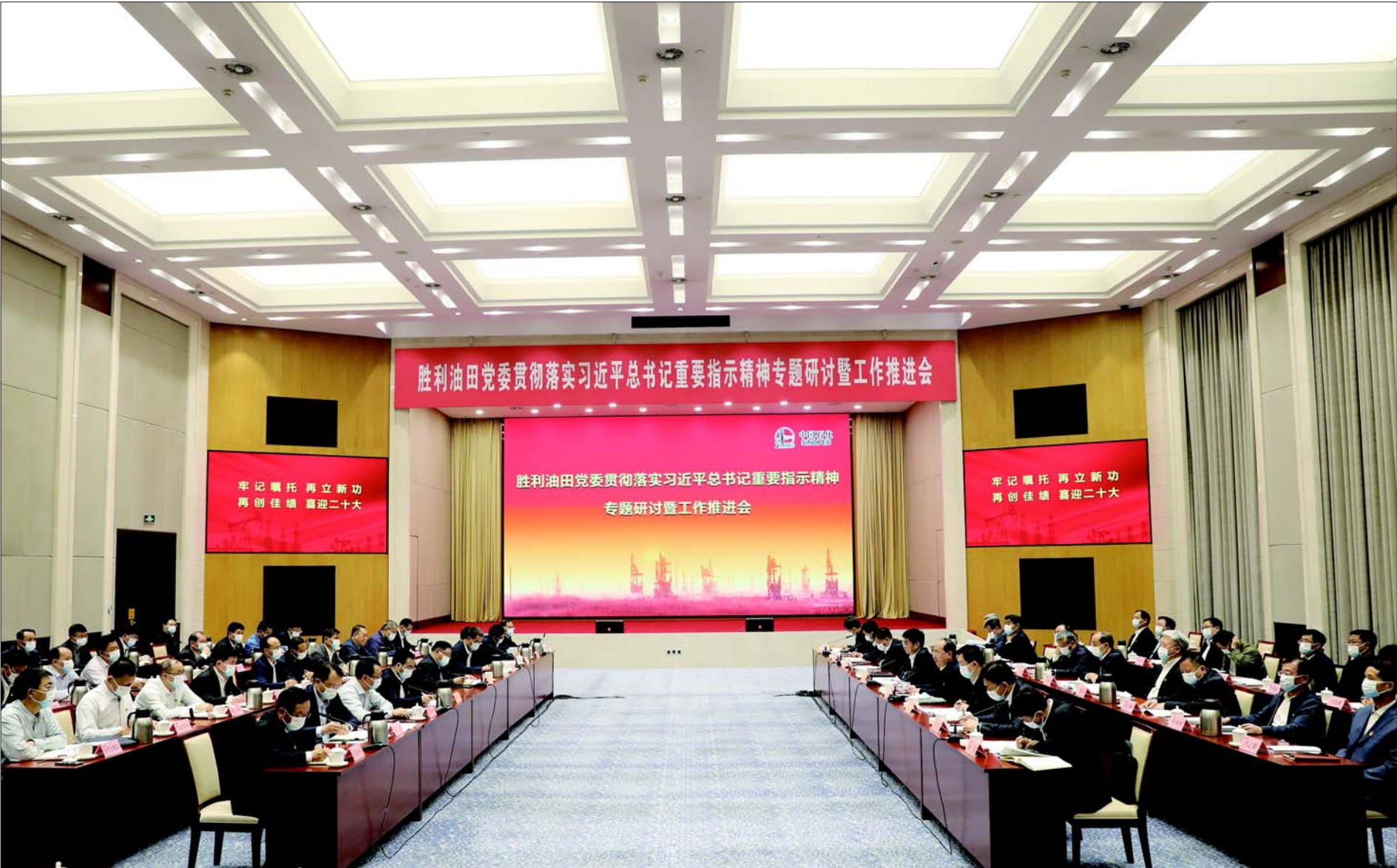
油田党委召开贯彻落实习近平总书记重要指示精神专题研讨暨工作推进会。