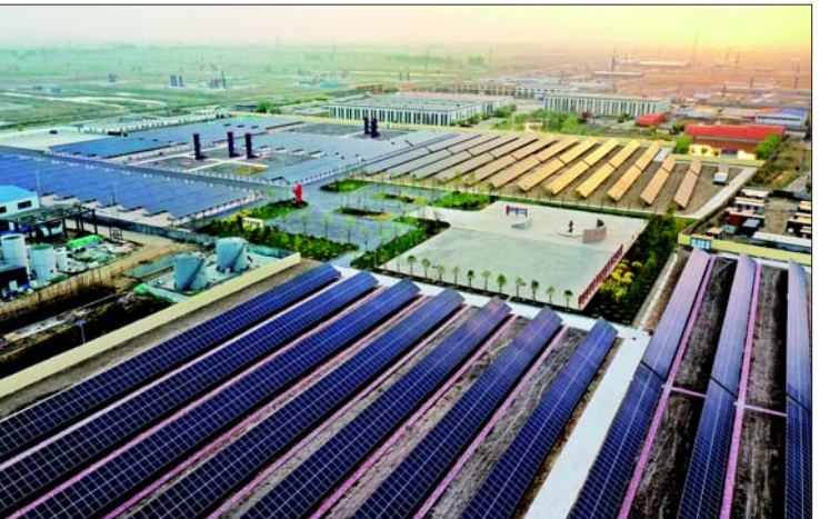
胜利油田在营二井区域实施的风光热储多能互补综合利用项目,每年可发电近900万千瓦时,年减排二氧化碳9000余吨,被誉为“传统能源和新能源结合的典范”。

党建工作与生产经营相融互促,为端牢能源饭碗打下坚实基础,结出累累硕果:勘探上取得一系列重大突破和商业发现,增储上产新领域新方向更加明确;开发上新建产能持续增长,技术指标有效改善,效益稳产基础不断夯实;经营上主要经营绩效指标持续提升,在质的提升中实现量的增长。