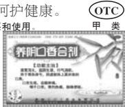
口臭口疮便秘胃难受, 请用养阴口香合剂! (广告)

灰指(趾)甲是“甲癣”的俗称,是病原真菌引起的甲感染。灰指甲变形、发黑(黄)需及时治疗,避免传染健康指甲,灰指甲患者选药,请认准伊甲牌复方聚维酮碘搽剂,国药准字H52020539,专药专治。