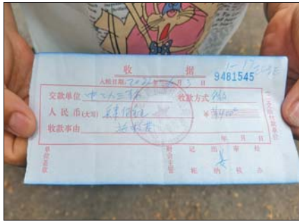
杨女士缴纳400元停车费的收据。(资料片)

据了解,秉鸿救援的全称是“济阳县秉鸿汽车维修救援服务中心”,其性质是“个体工商户”,注册资本为0.001万元人民币。“济阳区给咱这边有补助,(济南新旧动能转换)起步区那边暂时没咱这边的补助。”秉鸿救援负责人张经理称,同样是交警部门查扣的事故车辆,济阳区的车主不