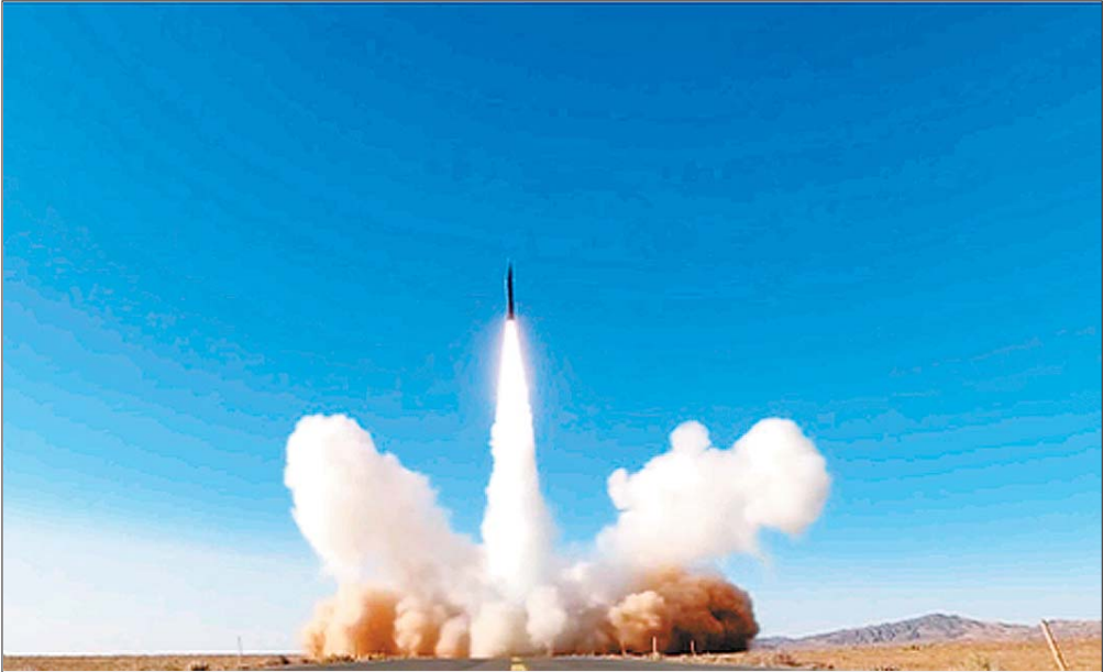
央视军事于7月30日发布名为“展示!81秒看中国军人的实力”的视频,首次公开某高超音速导弹发射的画面。