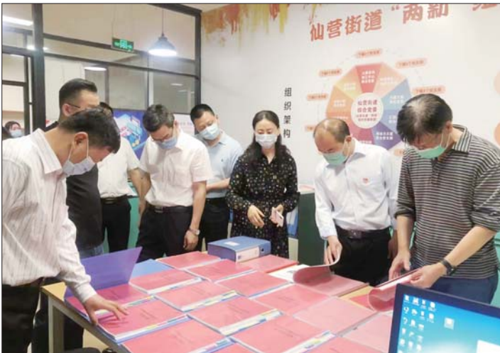
市委党校组织教师深入基层调研。