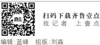
扫码下载齐鲁壹点 找记者 上壹点