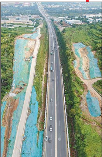
省道103旅游公路项目山体开挖段最高处下落约29米。

千古百业兴，先行在交通。近日，在近30公里的省道103旅游公路施工线上，工程机械开足马力，呈现出一片施工忙的场景。自8月以来，该项目近期出现了多处工程节点：柳埠大桥新桥桥体基本成型，仲宫大桥新桥开始吊装第一片梁板，部分路段正进行路基施工……省道103旅游公路推进速度加快，计划在年底前建成通车。