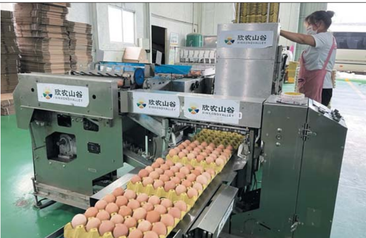
欣农山谷为周边村集体和村民增加收入。

集中财力支持乡村振兴和城乡融合发展,统筹整合资金13698万元,用于95个涉农项目建设。优化经济社会发展金融赋能作用,助力全区乡村振兴发展和“三变”改革;在全区开展“资源变资产、资金变股金、农民变股东”改革试点工作。包括深化农村集体资产清资核资,成立股份合作社、编制村庄发展规划、选准优势特色产业、引进和培育发展承接载体,建立多元化的融资体制等重点工作。深入实施乡村建设行动,探索拓宽农村集体经济发展和群众增收新路径,有效激发乡村振兴新活力,推动农村经济社会高质量发展。开展“百企结百村 消除薄弱村”专项行动,整合社会各类资源参与服务乡村振兴,搭建企业助力薄弱村发展壮大集体经济的桥梁纽带,补齐短板弱项,解决全区“三农”发展不平衡不充分问题。