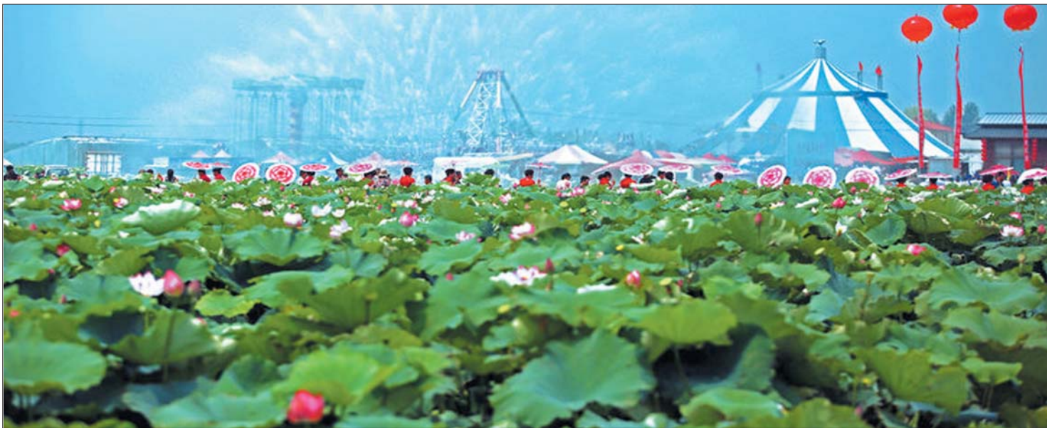
盛夏的白云湖万亩荷塘。