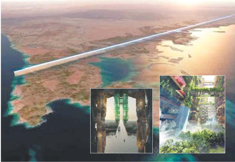
“镜线”视觉效果图(大图)和城中城“线”视觉效果图(小图)。

王储之前,他是沙特的副王储、第二副首相兼国防大臣。 在穆罕默德主导下,沙特牵头多国对也门胡塞武装发起了代号“果断风暴”的军事行动。作为沙特经济和发展事务委员会负责人,他筹划了雄心勃勃的“沙特2030愿景”经济转型计划,旨在使沙特经济摆脱对油气等能源产业的严重依赖,积极推动发展教育、军工、房地产和旅游业,并使沙特成为国际投资大户。作为沙特阿拉伯国家石油公司(沙特阿美)最高委员会的主席,穆罕默德还推动沙特阿美石油公司上市。 按照《彭博商业周刊》的说法,穆罕默德十分勤勉,一天工作16个小时。此外,他十分注意个人形象,和夫人育有四个孩子。据身边的工作人员透露,穆罕默德喜欢潜水运动等水上项目,还是苹果公司产品的“粉丝”。 法新社称,对于沙特这个一半国民都在25岁以下的国家来说,穆罕默德代表着年轻人的希望。不少人对他满怀期待,认为他果断推行的经济、社会改革将带领沙特走上更好的道路。 超级工程展现雄心 穆罕默德不仅在豪宅和收藏品上豪掷千金,还在沙特西北部规划了新未来城(Neom)。“我想要建立我的‘金字塔’。”在美国《华盛顿邮报》的报道中,穆罕默德这样描述新未来城计划。为摆脱对石油收入的依赖,沙特2016年发布“沙特2030愿景”,斥资约1万亿美元建设作为愿景一部分的新未来城。 新未来城占地2.65万平方公里,毗邻红海和亚喀巴湾,靠近经由苏伊士运河的海上贸易航线。据路透社报道,新未来城计划2025年初具规模。这座城市聚焦能源与水、生物科技、食品、先进制造业和娱乐业等九大行业,未来完全依靠新型能源供电。 去年1月,穆罕默德宣布将在新未来城建造一个名为“线”的零汽车、零排放城中城。作为新未来城董事会主席,他还在网站发布视频介绍,“线”将是一座长条状城市,“是一个以人类优先、文明(方面)的革命性