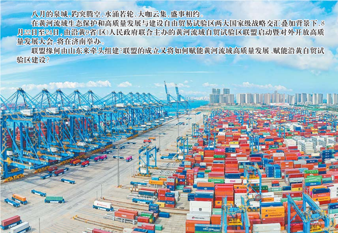
山东自贸区青岛片区自动化码头。

山东视察，并主持召开深入推动黄河流域生态保护和高质量发展座谈会，要求山东努力在推动黄河流域生态保护和高质量发展上走在前，这为山东做好黄河相关工作提供了根本遵循和行动指南。