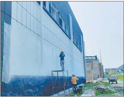
储酒库建成,正在进行喷涂外墙墙漆。

今年以来,玉皇庙镇在基础设施建设上加大投入,实现畅通城市“大动脉”和疏通“毛细血管”同步推进。投资2400万元对镇区14条道路路面、雨污水管网、路灯等进行改造和提升,对土马河公园、市民文化广场进行绿植补充、园路铺设、基础设施维修;投资1279万元,新建文苑社区公园、兴业社区公园,对快速路、玉凯路道路节点进行绿化提升;统一规划、高标准实施镇区街道亮化美化工程,规划建设月季大道、紫薇大道,一街一特色,一处一提升。