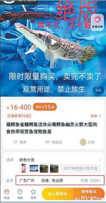
某电商卖家仍在售卖鳄雀鳝。