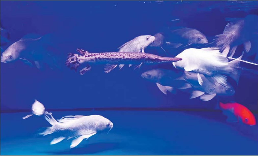
济南华龙水族花卉市场某水族店仍在售卖鳄雀鳝。

鳄雀鳝系肉食鱼类,其体形巨大,性情凶猛,生长速度快,食量大,会大量捕食鱼类和其他生物,对生态具有极强的破坏性。通过一场网络围观,鳄雀鳝的危害性已经广为人知,然而记者调查发现,无论是线下还是线上,仍然有人在进行鳄雀鳝的买卖。