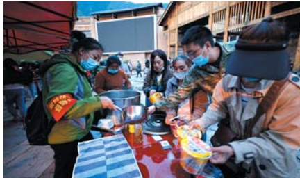
工作人员在磨西镇发放热水和方便面。

据成都高新减灾研究所(简称减灾所)官网消息称，该所与中国地震局联合建设的中国地震预警网成功预警此次强震。预警系统在泸定6.8级地震发生时第5秒发出预警，给康定市提前7秒预警，雅安市提前20秒预警，给成都市提前50秒预警，四川大量社区、小区地震预警大喇叭提前发出预警，千万民众的电视、手机发出预警，疫情防控工作人员、居民听到预警后紧急避险。