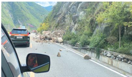
9月5日，四川省森林消防总队甘孜支队在前往泸定县的路上发现的塌方情况。

四川省应急管理厅、四川省粮食和物资储备局紧急调配中央、省级救灾帐篷4400顶、棉被14000床、折叠床14000张，共计3.2万余件的第一批救灾物资紧急支援灾区。地震发生后，国家(四川)中医紧急医学救援队立即响应，救援队基地医院四川省骨科医院迅速研判灾情并集结队员，调度应急物资，派出快速反应小分队赶赴震区开展救援工作。