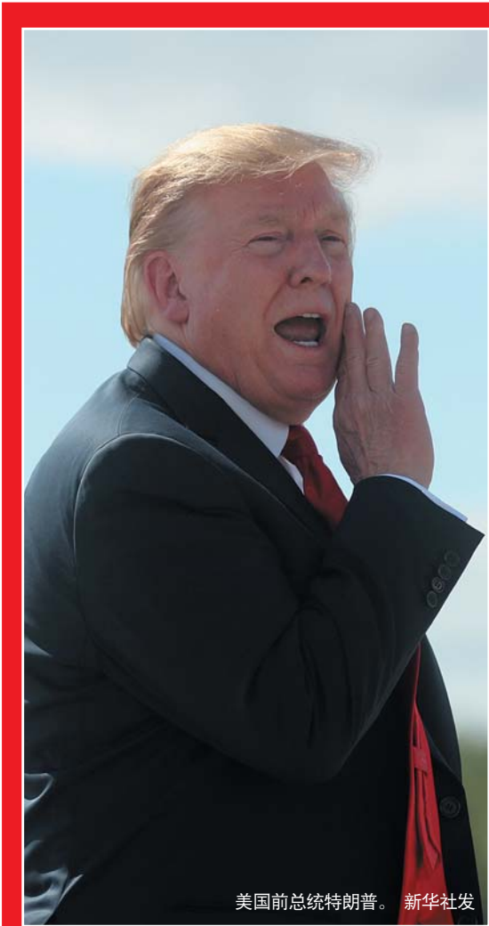
美国前总统特朗普。