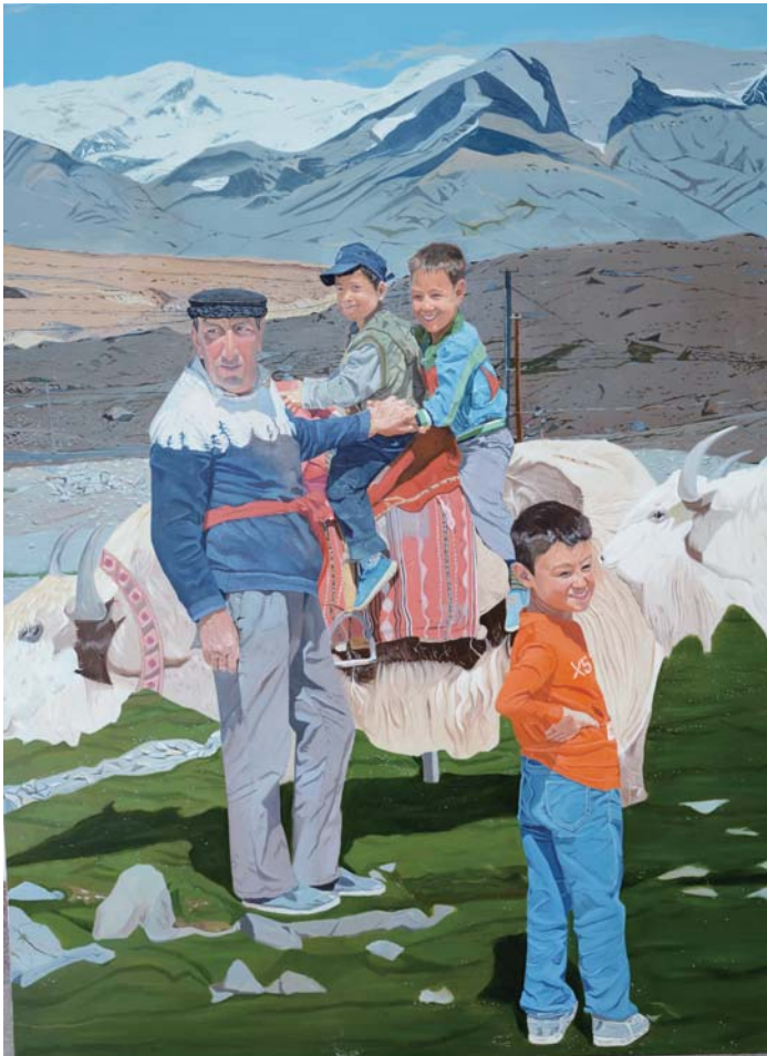
《幸福时光》 160cmx120cm 布面油画 2019年