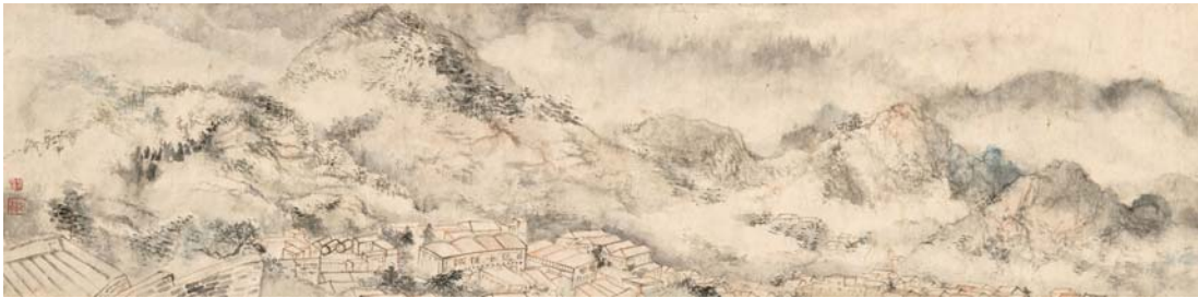
《青岛刘个庄写生》 35cmx140cm 中国画 2016年