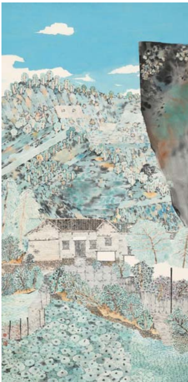
《茫茫九派流中国》 70cmx140cm 中国画 2021年

对于韩国玉而言,他画的是一种生活,更是一种安静、单纯、轻松的快乐。“路漫漫其修远兮”,真诚地祝愿他在这条快乐的艺术道路上越走越远,越走越宽。