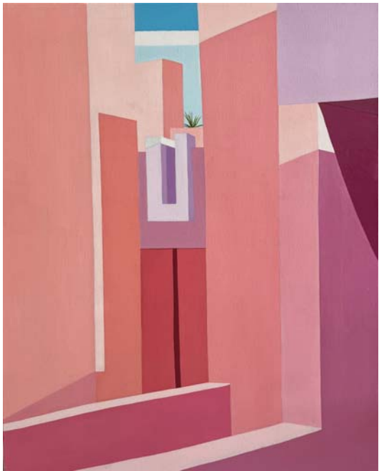
《空间一》 80cmx100cm 布面油画 2022年

主办:山东省文化和旅游厅 承办:山东美术馆 展览时间:2022年9月20日至10月9日 展览地点:山东美术馆二楼“锐”空间